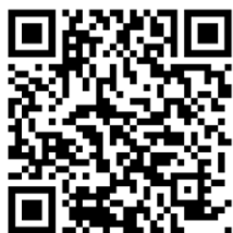
QR-Code virtuelle Ausstellung

Die gesamte Ausstellung mit allen Stücken inklusive vieler Hintergrundinformationen, Bildern und Videos ist jederzeit auch Online besuchbar. Die virtuelle Ausstellung wird finanziell unterstützt von der Firma Häfele und ist auf der Webseite www.schreiner-bw.de verlinkt.