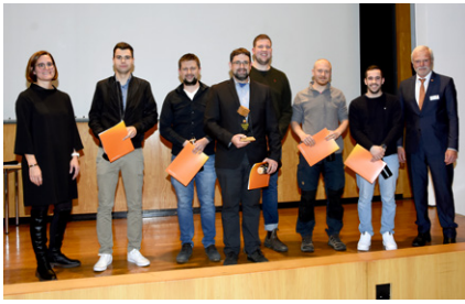
Teilnehmer der „SchreinerWerke“