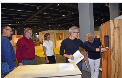
Jury „Die Gute Form“ bei der Arbeit