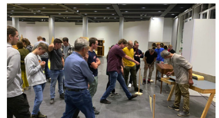
Führung durch die Ausstellung