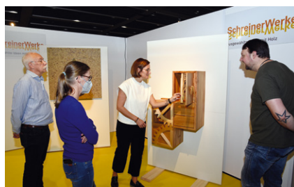
Jury des Wettbewerbs „SchreinerWerke“