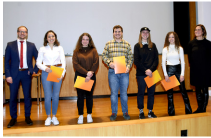
Siegerinnen und Sieger „Die Gute Form“