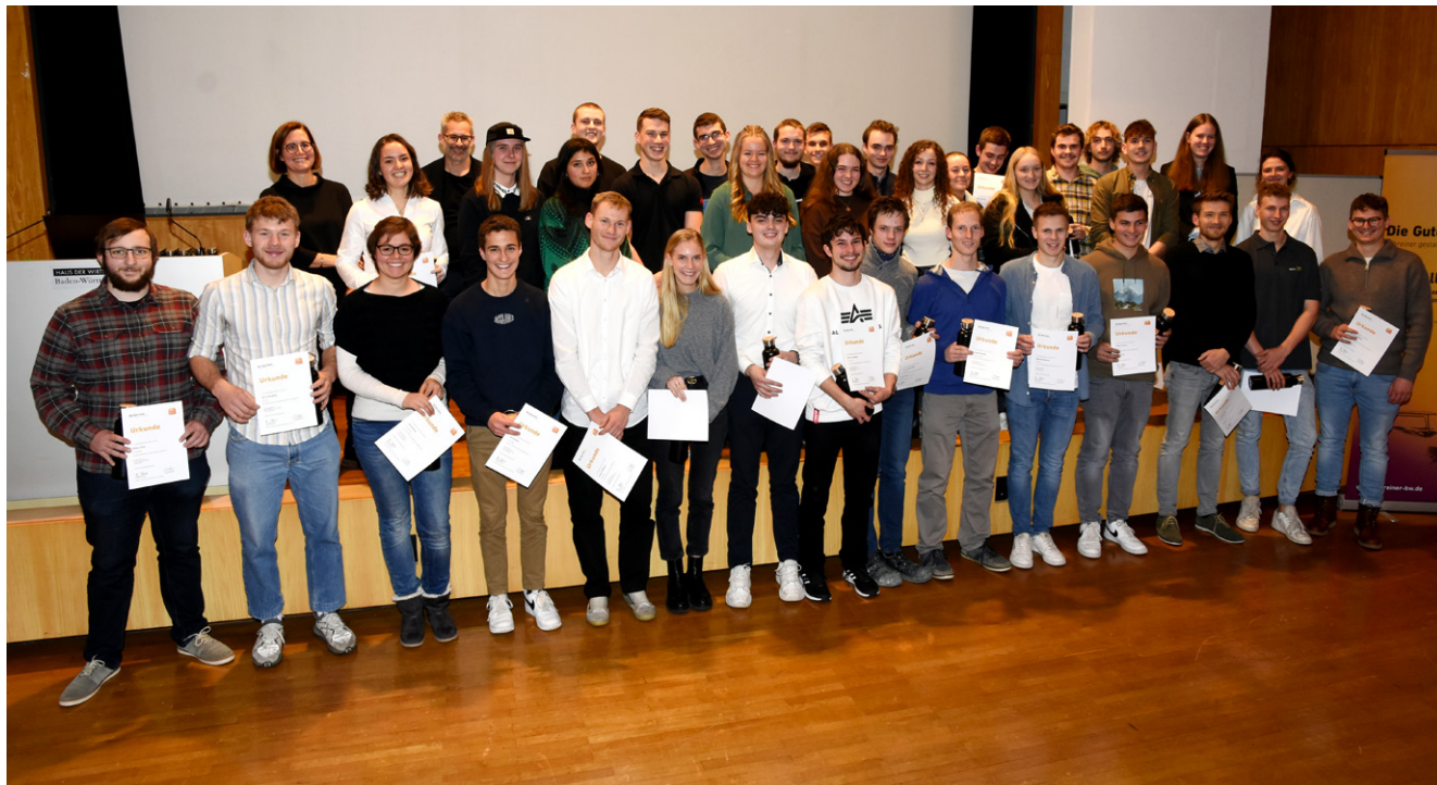
Alle Innungssiegerinnen und -sieger im Wettbewerb „Die Gute Form“